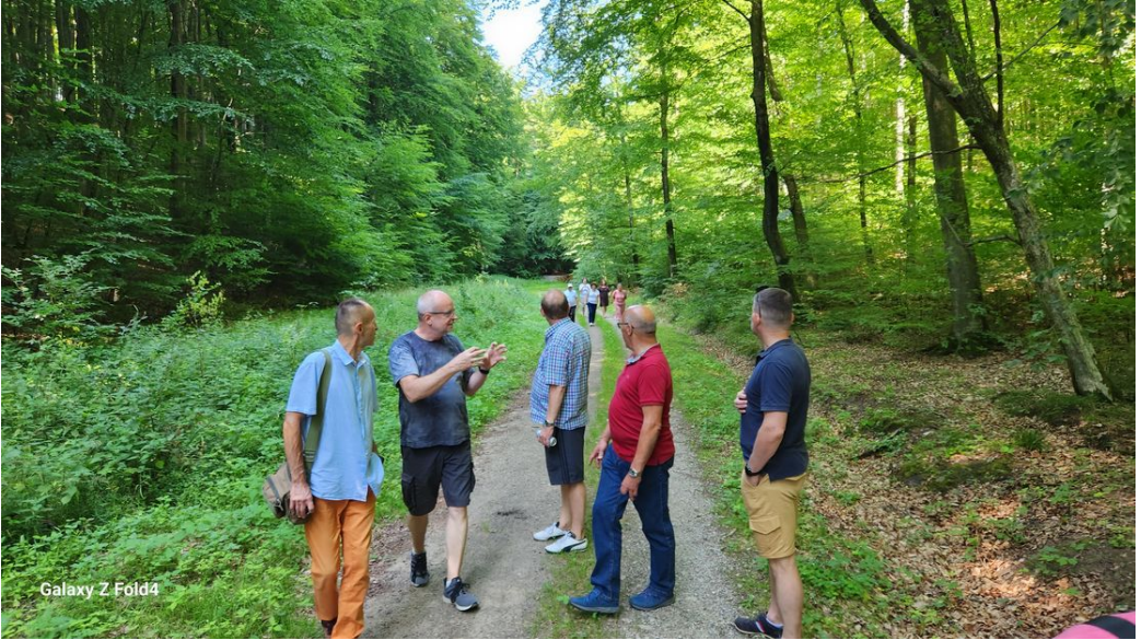
Galaxy Z Fold4