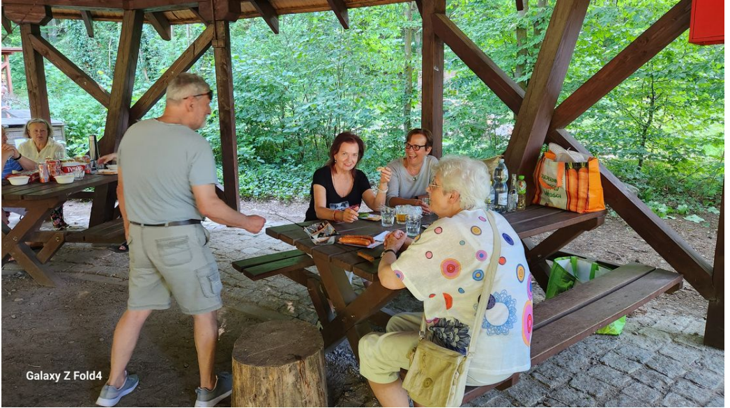
Galaxy Z Fold4