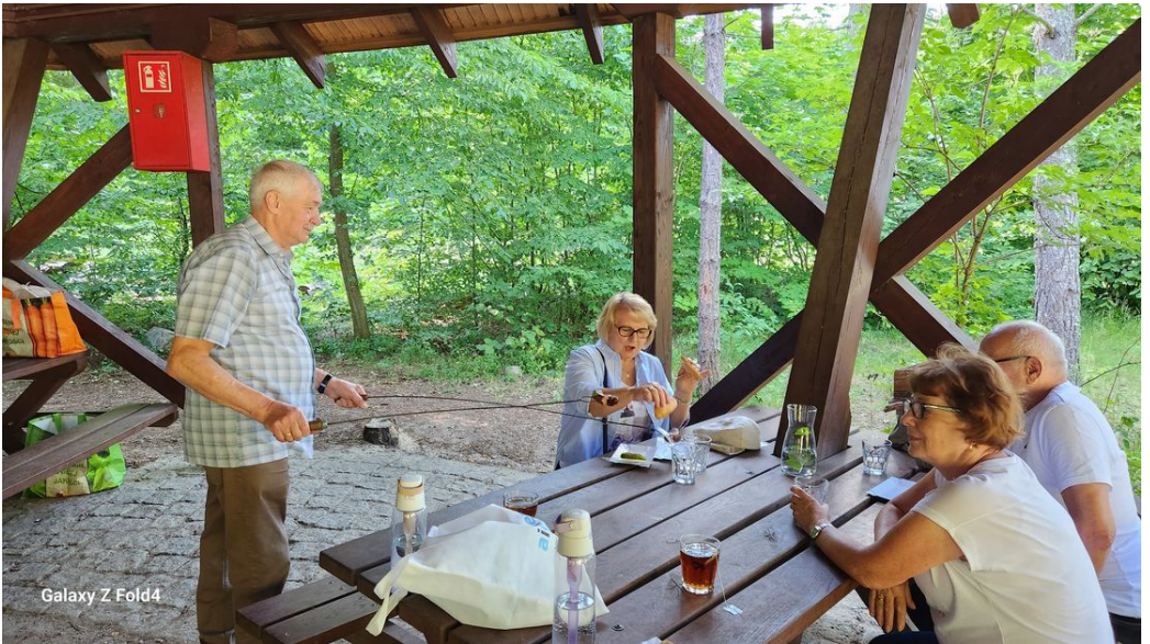
Galaxy Z Fold4