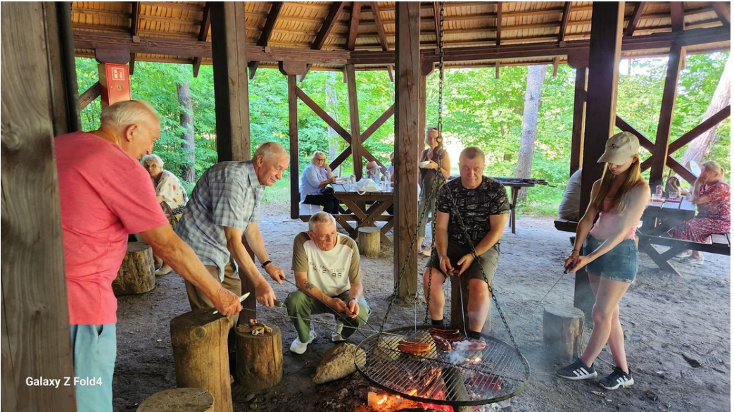
Galaxy Z Fold4