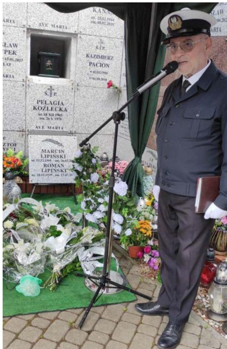
Tekst i zdjęcia: A. Kurszewski