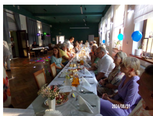
Opr. Ewa Macek, Jacek Świdorski