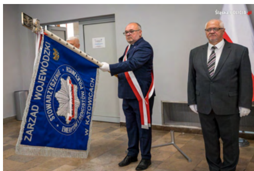
Tekst: Mieczysław Skowron